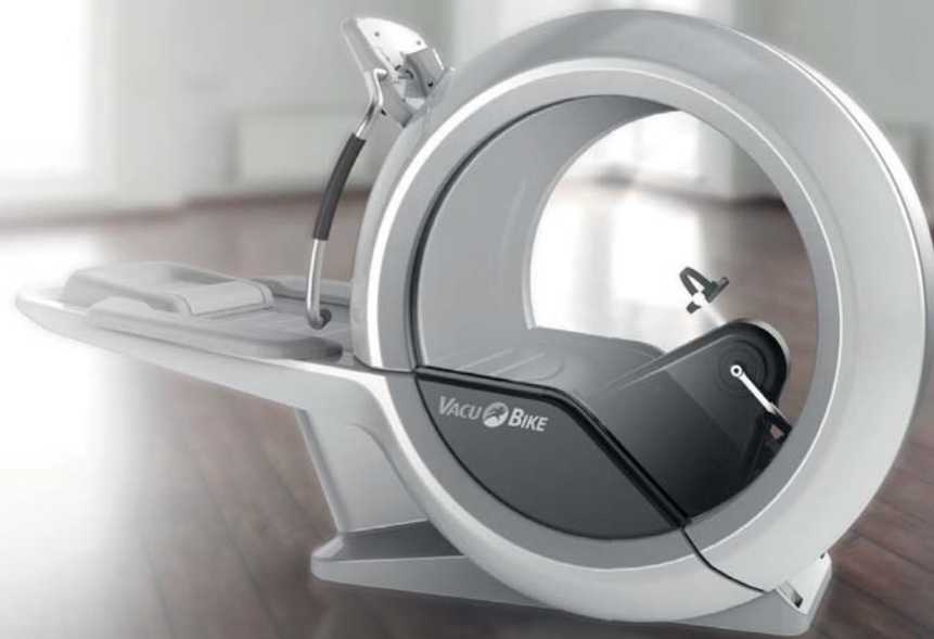
Obr.1 13. duben 1920 – první patent cvičebního zařízení kombinujícího pohyb a podtlak.